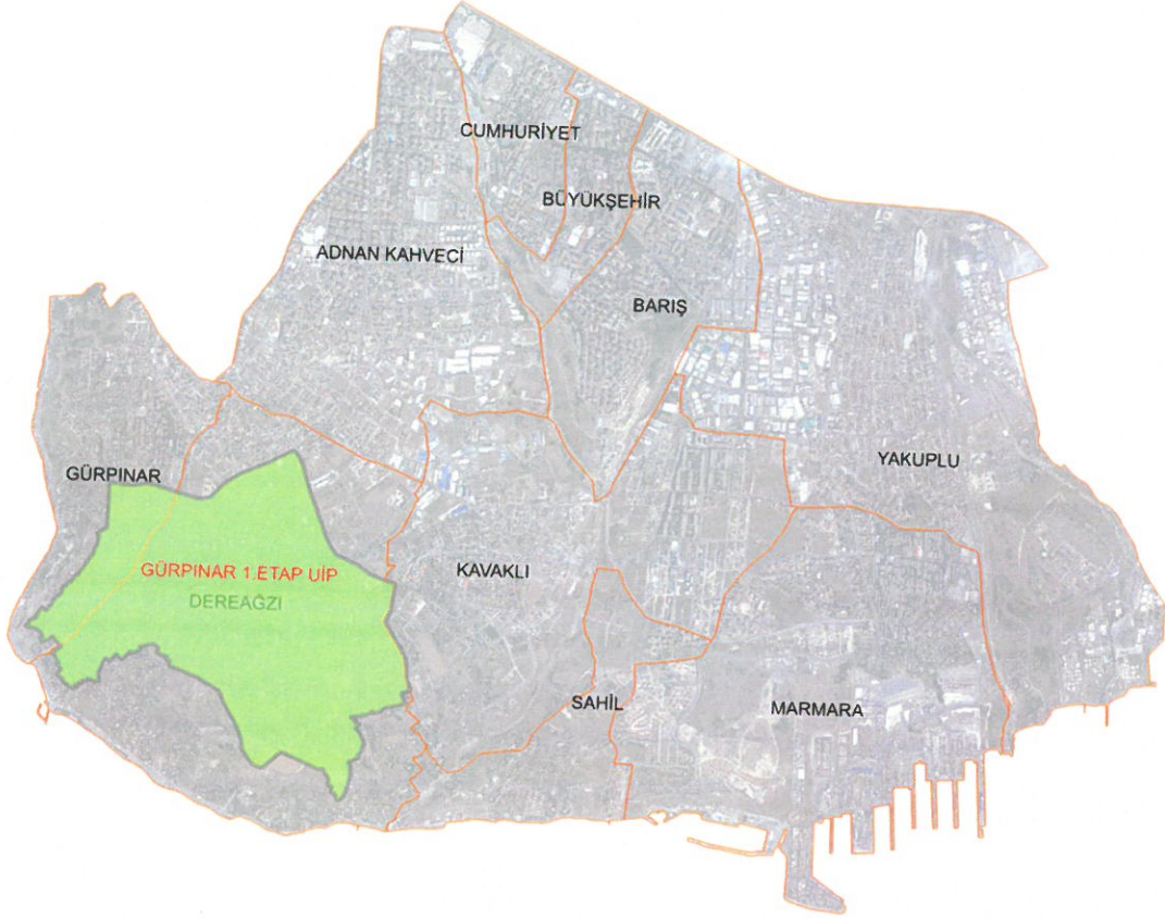
Şekil 1. Planlama Alanı'nın Beylikdüzü İlçesi İçerisindeki Konumu

Bahse konu plan notu deęişikliği teklifine ilişkin meri 1/1000 Ölçekli Gürpınar 1. Etap Uygulama İmar Planı sınırı içerisinde kalmaktadır.