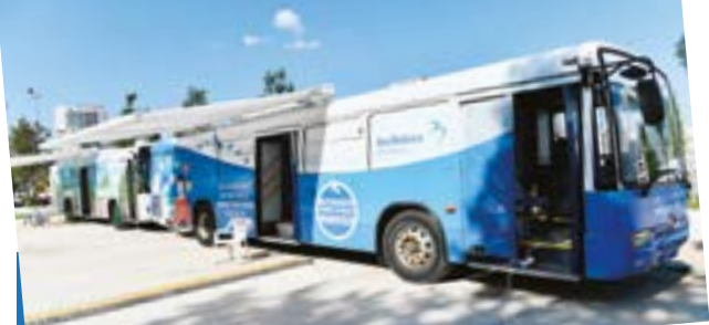
Beylikdüzü Belediyesi'nin hayata geçirdiği Gezici Hizmet Otobüsleri'nden Mobil Sağlık Aracı ile Gezici Kütüphane etkinlik boyunca vatandaşlara ücretsiz olarak hizmet verdi.

mısır ikram edildi. Etkinlikte konuşan Beylikdüzü Belediye Başkanı Mehmet Murat Çalık, "Tüm çabamız çocukların sağlıklı, mutlu ve huzurlu bir yaşam sürmeleri için. Beylikdüzü Belediyesi olarak ailelerimizin bu mutlu gününde yanlarında olmaktan dolayı oldukça mutluyuz" şeklinde konuştu.