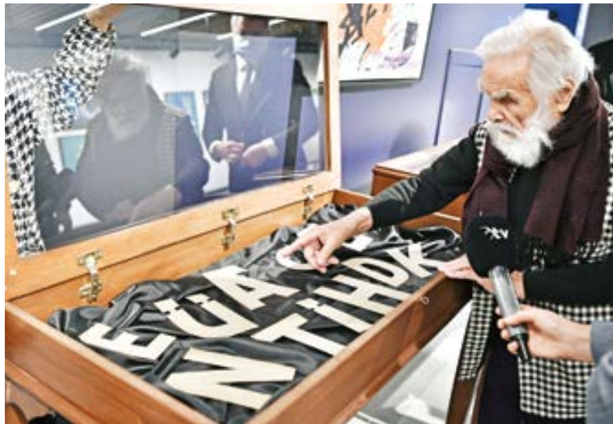
Usta sanatçı yazının 6 bin yıllık geçmişini anlatarak Anıtkabir duvarlarında kullanılan harflerin sırrını açıklıyor.

Evet, doğru. Bütün çalışmalarımın hepsi benim için o zamanki heyecanın, bir duygunun sonucudur. Çalışmalarımın hiçbirine en güzelidir demiyorum. Çünkü bir tercih yapmak istemem. Neden 'Yarın' diyorum? Kendimi yarına bağlıyorum. Yarınları hazırlıyorum. Ben doymuyorum. Sofradan aç kalkıyorum. Siz de öyle yapın. Sofradan aç kalkın.