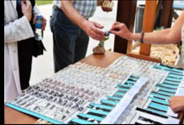
Beylikdüzü Belediyesi Park ve Bahçeler Müdürlüğü standını ziyaret eden vatandaşlara; ata tohumları, fideler ve ağaçtan yapılan telefon tutacağı, mumluk gibi hediyeler verildi.

nomi ve eğitim gibi konularda alanında uzman pek çok önemli isim, Yaşam Vadisi'nde İstanbul halkıyla bir araya geldi. Bir hafta boyunca dopdolu takvimiyle devam eden etkinliklerde, belediyenin tüm birimleri katılımcıların keyifli dakikalar geçirebilmesi için hazır bulunurken hem etkinlik alanında hem de standların bulunduğu alanlarda önlemler üst seviyede tutuldu.