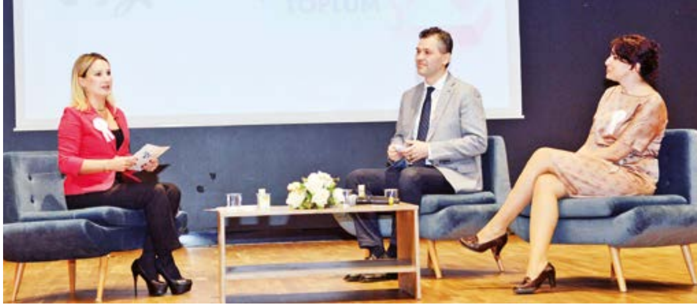
Beylikdüzü Belediyesi farkındalık ayı kapsamında ayrıca "Sağlıklı Hayat Sağlıklı Toplum" konulu bir seminer de gerçekleştirildi. Beylikdüzü Belediyesi, Medicana International İstanbul Hastanesi ve Özel Florya Hastanesi iş birliğiyle düzenlenen seminerde, alanında uzman hekimler tarafından meme kanseri ve erken tanı süreciyle ilgili önemli bilgiler verildi.

ve mamografi taraması ücretsiz olarak yapılırken ihtiyaç doğrultusunda kişilere ulaşım desteği de belediye tarafından sağlanıyor.