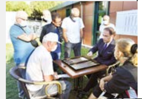
8. Barış ve Sevgi Buluşmaları'nda düzenlenen ödüllü streetball, tavla ve masa tenisi turnuvaları büyük çekişmelere sahne oldu.

Festival boyunca Yaşam Vadisi 6 Mayıs Gençliğimiz Var Sahnesi'nde gerçekleşen konserlerde; Mehmet Erdem, Beylikdüzü Gençlik Senfoni Orkestrası, Feride Hilal Akın, Gece Yolcuları ve Hüseyin Turan müzikseverlere unutulmaz saatler yaşattı. Konserler öncesinde sahnede yerini alan Ersin Show ile de Yaşam Vadisi'ni dolduran coşkulu kalabalık, görsel şölen tadında anlar yaşadı.