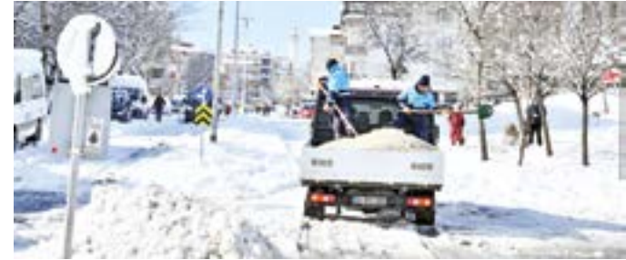
Ekipler 24 saat hazır bulunarak, çalışmalarını sürdürdü.