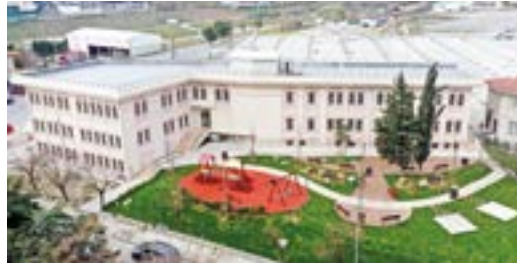
Müftülük, Mevlana Camii Kur'an Kursu ve Taziye Evi