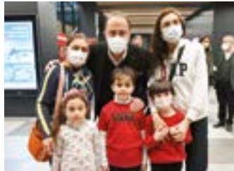
Belediye Başkanı Mehmet Murat Çalık çocuklarla bilim atölyesine katıldı.

B eylikdüzü'ndeki çocuklar yarı yıl tatilinde, hem yeteneklerini keşfedecekleri hem de gelişimlerine katkıda bulunacak etkinliklerde buluştu. Beylikdüzü Belediyesi tarafından düzenlenen Yarı yıl Şenliği'nde doyasıya eğlenen çocuklar; eğitici atölye çalışmalarının yanı sıra sinema ve tiyatro gösterimlerine ücretsiz katılma imkânı buldu. 6-12 yaş arası çocukların katıldığı etkinlikler kapsamında çocuklar; yaratıcı drama, kitap ayracı boyama, dans, ritim, boyama ve bilim atölyelerinde eğlenirken öğrenmenin tadını çıkardı. Atölye çalışmalarının yanı sıra Aşık Veysel Sahnesi, Ayşen Gruda ile Şener Şen Sinema Salonları'nda; Kırmızı Başlıklı Pinokyo, Cırcır Böceği Durmadan Öteryus, Aşçı Fare – Ratatouille sinema ve tiyatro gösterileri çocuklar için sahnelendi. Ayrıca, “Karneni Getir Kitabını Götür” uygulamasıyla da ilçede ikamet eden ya da eğitim alan öğrencilere kitap hediye edildi.