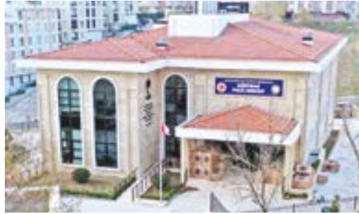
Gürpınar Polis Merkezi Amirliği

Her türlü hizmetin vatandaşlara en iyi şekilde ulaşması için mesai harcayan ve diğer kamu kurumlarını da her koşulda destekleyen Beylikdüzü Belediyesi törenlerin ikinci ayağında da iki önemli projenin açılışını gerçekleştirdi. Gürpınar Polis Merkezi Amirliği, 7/24 görev başında olan ve toplumun güvenliği için canlarını feda etmekten çekinmeyen Türk Polis Teşkilatı'na, İstanbul Büyükşehir Belediyesi desteğiyle inşa edilen Beylikdüzü Müftülük, Mevlana Camii Kur'an Kursu ve Taziye Evi ise Beylikdüzü Müftülüğü'ne tahsis edildi.